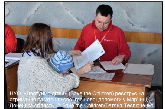
НУО «Врятуймо дітей» (Save the Children) реєструє на отримання багаточислової грошової допомоги у Мар'їнці, Донецька область.

Поки формуються плани щодо підготовки до зими, партнери продовжують надавати допомогу по всіх найважливіших напрямках, щоб покрити нагальні потреби. Попри труднощі з обмеженим гуманітарним доступом, особливо на НПУТ, та недофінансуванням, кластери в умовах надзвичайної економії намагаються мінімізувати вплив конфлікту та відновити гідність постраждалого населення. Адресна допомога в області освіти, охорони здоров'я, надання продовольчих та непродовольчих товарів, забезпечення доходів, житла, захисту, та водопостачання, санітарії та гігієни надходить до найбільш уразливих з обох сторін «лінії розмежування». За можливості ці зусилля включають як допомогу в натуральній формі, так і у формі грошових переказів.