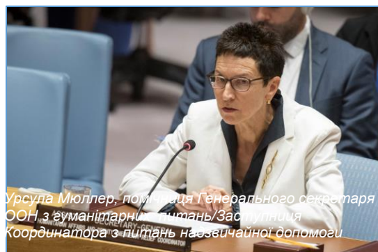
Урсула Мюллер, помічниця Генерального секретаря ООН з гуманітарних питань/Заступниця Координатора з питань надзвичайної допомоги

6 червня Рада Безпеки Організації Об'єднаних Націй (РБ ООН) опублікувала Президентську заяву стосовно України, в якій члени висловили «глибоку занепокоєність у зв'язку з недавнім погіршенням ситуації у сфері безпеки на сході України та серйозним впливом цього на цивільне населення». У Заяві також було підкреслено «необхідність розширення заходів, спрямованих на полегшення страждань цивільного населення». Заяву було зроблено за підсумками брифінгу РБ ООН з питань України від 29 травня, який проводився вперше з лютого 2017 р.