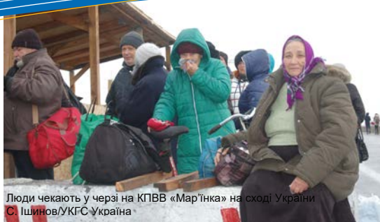
Люди чекають у черзі на КПВВ «Мар'їнка» на сході України