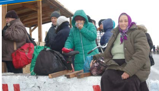
Люди ждут в очереди на КПВВ «Марьинка» на востоке Украины