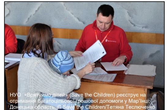
НУО «Врятуймо дітей» (Save the Children) реєструє на отримання багатопільової грошової допомоги у Мар'їнці, Донецька область.

Поки формуються плани щодо підготовки до зими, партнери продовжують надавати допомогу по всіх найважливіших напрямках, щоб покрити нагальні потреби. Попри труднощі з обмеженим гуманітарним доступом, особливо на НПУТ, та недофінансуванням, кластери в умовах надзвичайної економії намагаються мінімізувати вплив конфлікту та відновити гідність постраждалого населення. Адресна допомога в області освіти, охорони здоров'я, надання продовольчих та непродовольчих товарів, забезпечення доходів, житла, захисту, та водопостачання, санітарії та гігієни надходить до найбільш уразливих з обох сторін «кліні розмежування». За можливості ці зусилля включають як допомогу в натуральній формі, так і у формі грошових переказів.