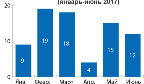
Инциденты, повлиявшие на услуги водоснабжения и санитарии (январь-июнь 2017)

Нарушение работы из-за постоянных обстрелов и повреждений инфраструктуры приводит к регулярному выбросу сточных вод, что создает большую угрозу для окружающей среды и состояния здоровья населения. По-прежнему наблюдаются негативные последствия обстрелов сторонами конфликта в районах расположения