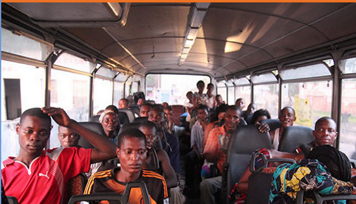
Transport des migrants