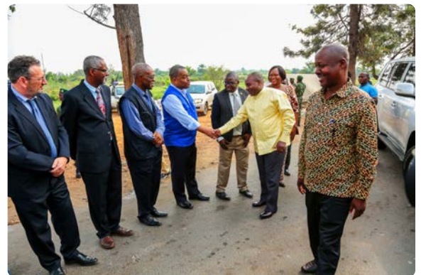
Le Deuxième Vice-Président de la République du Burundi visite les sites de préparation

Accompagné des hauts cadres du Ministère de la Santé Publique et de la Lutte contre le Sida (MSPLS), le deuxième Vice-Président a effectué un parcours de mise à jour et a été briefé sur les efforts mis en œuvre dans la préparation en vue de protéger les personnes vivant au Burundi contre un éventuel cas de la MVE.