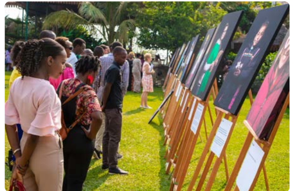
Exposition de photos 'One Day I Will' du photographe Vincent Tremeau au WHD 2019.

La journée a commencé avec une exposition de photos intitulée 'Un Jour, Je Serai' prises par Vincent Tremeau, photographe lauréat de plusieurs prix. Celui-ci consistait d'une série de portraits qui documentent les rêves et les ambitions de 30 jeunes filles dans 9 pays en crise.