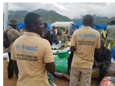
Foire de distribution des articles ménagers essentiels et des abris d'urgence en faveur des retournés de Bijombo à Uvira.

Grâce au Fonds Humanitaire de la République démocratique du Congo 1 , le Conseil Norvégien pour les Réfugiés (NRC) a débuté, le 20 mai 2019, une opération de distribution du cash en vivres, articles ménagers essentiels et abris d'urgence en faveur de 16 000 retournés. Les bénéficiaires proviennent de l'axe Centre, les Moyens et Hauts Plateaux du Groupement de Kigoma ; ils avaient fui les intercommunautaires dans les Hauts Plateaux d'Uvira, dans le Groupement de Bijombo, entre avril et août 2018. Les défis majeurs dans la mise en œuvre de ce projet ont été notamment la précarité des conditions sécuritaires et l'analyse de risques de protection dans une optique sensible aux dynamiques du conflit.