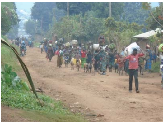
Le 7 juillet, des milliers de personnes ont commencé à fuir les affrontements entre groupes armés.

Au moins 50 000 personnes déplacées aurait été enregistrées dans les zones de de Nyanzale et Kanyabayonga suite aux affrontements entre groupes armés qui ont éclatés le 7 juillet dans la localité de Kikuku, en territoire de Rutshuru. Il s'agit d'un dénombrement préliminaire dans les zones où des acteurs humanitaires sont présents. Des milliers d'autres personnes auraient fui vers les localités du territoire de Masisi (Mweso, Kalembe, Kashuga, et Ihula). La compilation des données est toujours en cours. La communauté humanitaire suit la situation avec attention.