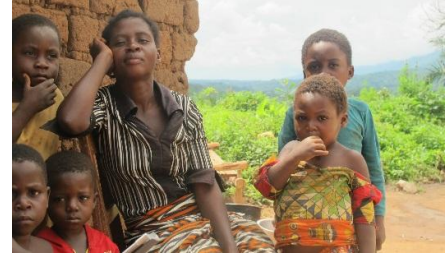
Mukera, Sud-Kivu. Veuve et mère de 5 enfants, de retour au village le 09 novembre 2017 après deux semaines en déplacement suite aux affrontements armés.

Au mois de novembre dernier, ACTED avait conduit une évaluation des besoins qui avait rapporté la présence d'environ 3 000 ménages déplacés dans la zone de Kalonge. Ces derniers sont toujours confrontés à des besoins urgents en sécurité alimentaire et nutrition, en eau et assainissement ainsi qu'en articles ménagers essentiels. La réponse médicale conduite par un partenaire international s'est arrêtée au mois de décembre avec la clôture du projet.