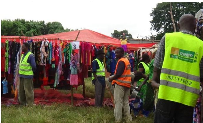
Des retournés dans le Territoire de Mitwaba assistés en articles ménagers essentiels, lors d'une foire de RRMP.

Ils ont un accès limité aux soins de santé par manque de moyens financiers. Si certains doivent parcourir plus de 30 km à pied pour atteindre le poste de santé le plus proche, d'autres sont réduits à recourir aux pratiques traditionnelles pour se soigner. En collaboration avec le PAM, l'ONG Action contre la pauvreté (ACP) soutient certaines structures sanitaires dans la prise en charge nutritionnelle des enfants, des femmes enceintes et allaitantes. L'Association de santé familiale (ASF), elle, appuie depuis 2013, les centres de santé en antipaludéens et autres matériels.