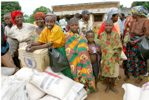
Des ménages vulnérables en insécurité alimentaire reçoivent l'assistance du PAM, Crédit : PAM

Ces personnes avaient fui une série d'attaques armées dans leur groupement où de nombreuses femmes avaient été enlevées et des civils tués. Malgré cette assistance, des besoins persistent dans d'autres secteurs. Dans le domaine de l'eau, hygiène et assainissement, la situation est aussi préoccupante : ces retournés ne disposent pas de latrine et les ménages consomment l'eau de puits non aménagés ou de rivières.