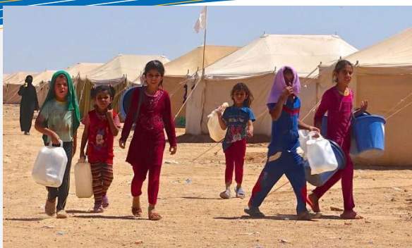
هاوکاری مروی خیراتراکراوه بو پرکردنوه‌ی پێویسته‌یه‌کانی ئاواره‌کانی رۆژنلای نهنبار.