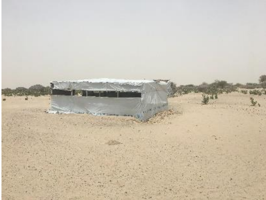
Figure 1 Ecole primaire de Amma

Il existe une école sur le site qui accueillait 302 enfants dont 80 filles, avec l'appui de 2 enseignants. L'école est actuellement fermée, en prévention de l'épidémie COVID19. Les enfants ne s'adonnent à aucunes activités extra scolaires.