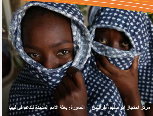
مركز احتجاز أبو سليم، طرابلس.