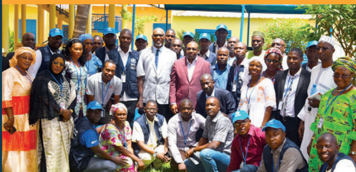
Rencontre de l'équipe des Médecins d'Appui OMS avec le Ministre de la Santé du Mali en présence du Représentant Résident de l'OMS

Bamako Kayes Koulikoro Sikasso Segou Mopti Tombouctou Gao Kidal Menaka Taoudénit