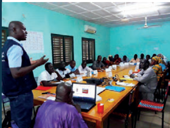
Formation du personnel de santé à Fana par les MDO de Koulikoro

3 Médecins d'Appui OMS déployés en moyenne par région sanitaire