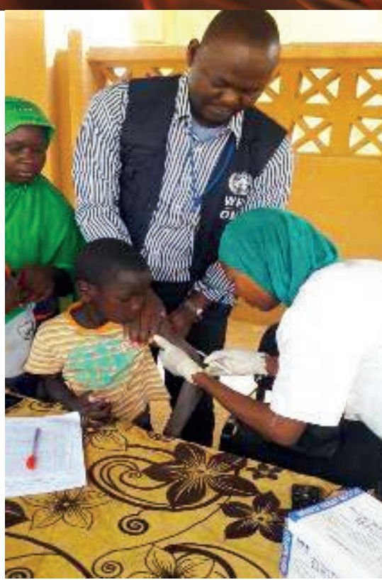
Supervision au cours de la riposte contre la rougeole dans le district sanitaire de Gao