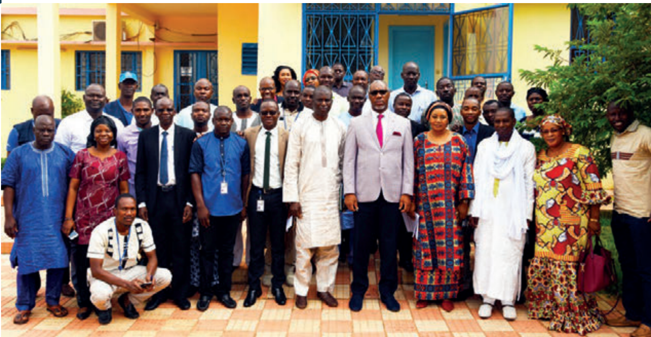
L'équipe des MDO avec le Représentant Résident de l'OMS lors de l'atelier d'induction avant leur déploiement sur le terrain. Octobre 2017