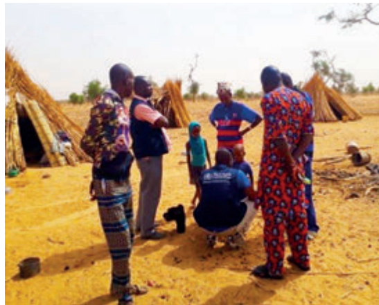
Investigation d'un cas de rougeole au hameau de Korolou-wé, Aire de santé de Koporopen Koro

Quelques chiffres sur les performances des MDO en 2018