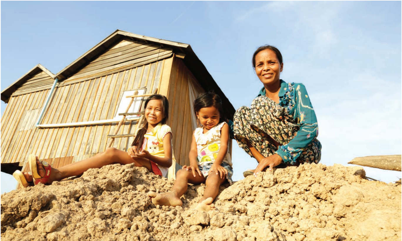
គ្រួសារកសិករនៅក្នុងតំបន់ដែលប្រឈមនឹងគ្រោះទឹកជំនន់នៅខេត្តកំពង់ធំ (រៀម សារ៉ាន់/អុកស្វាម)

ដំណាក់កាលទី ៣៖ ការច្នៃចាត់បញ្ចូលគំហើញ និងអនុសាសន៍។ ដំណាក់កាលនៃការសិក្សាស្រាវ ជ្រាវសកម្មភាពដោយមានការចូលរួម ត្រូវបានផ្សា ភ្ជាប់ទៅនឹងការធ្វើសវនកម្មយេនឌ័រនៅក្នុងដំណាក់ កាលទី ១ ក្នុងគោលបំណងដើម្បីផ្តល់ជាអនុសាសន៍ ចុងក្រោយ។ លទ្ធផលនៃការស្រាវជ្រាវនេះ នឹងត្រូវ បានប្រើប្រាស់ដើម្បីសម្រេចការរៀបចំកម្មវិធី និង ឧបករណ៍នាពេលអនាគត។