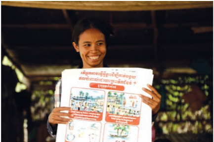
ការពន្យល់ណែនាំពីគោលគំនិតនៃការត្រៀមរៀបចំ គ្រោះមហន្តរាយ (អឺរ៉ុប សាវ៉ាន់អុកស្វាម)

វាមានតម្រូវការក្នុងការធ្វើការជាមួយយុវជន ជាពិសេសស្ត្រីវ័យក្មេង។ វិធីសាស្ត្រកាត់បន្ថយ ហានិភ័យសកម្ម គួរតែត្រូវបានលើកទឹកចិត្ត ដើម្បី ទាក់ទាញការចាប់អារម្មណ៍របស់ពួកគេ ដូចជាការ ធ្វើការស្ម័គ្រចិត្តនៅក្នុងការងារគ្រប់គ្រងគ្រោះ មហន្តរាយ។ ទោះជាយ៉ាងណាក៏ដោយ ខុបសគ្គ មួយចំនួនដូចជាលក្ខណៈតិចតួច ធ្វើឲ្យយុវនារីបង្វែរ ការចាប់អារម្មណ៍ទៅបម្រើការងារនៅក្រៅតំបន់ ឬក្រុមហ៊ុនសំណង់ដែលនៅក្បែរ ហើយដែលផ្តល់ ប្រាក់ឈ្នួលពលកម្មប្រសើរជាង។ ការសិក្សាផ្តល់ អនុសាសន៍ធ្វើការជាមួយអង្គការក្រៅរដ្ឋាភិបាល ស្ត្រី ដែលបច្ចុប្បន្នកំពុងបញ្ចុះបញ្ចូលរដ្ឋាភិបាល សម្រាប់ការជំរុញការចូលរួម និងភាពជាអ្នកដឹកនាំ របស់ស្ត្រី នៅក្នុងអង្គការមូលដ្ឋាន និងដើម្បីលើក ទឹកចិត្តដល់ពួកគេដើម្បីបញ្ចូលយេនឌ័រ និងទស្សនៈ ទាននៃការកាត់បន្ថយហានិភ័យគ្រោះមហន្តរាយ នៅក្នុងវិធីសាស្ត្ររបស់ខ្លួន។ បញ្ហានៃប្រាក់កម្រៃ ទាប គឺជាបញ្ហាអាទិភាពមួយសម្រាប់ការតស៊ូមតិ ជាមួយរដ្ឋាភិបាលនៅថ្នាក់ជាតិ។