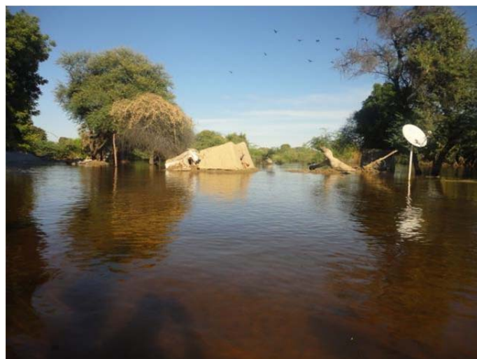
Crédit: OCHA Niger (Novembre 2013) – Vue des maisons détruites dans la commune de Gueskerou, région de Diffa, Niger

Environ 15 086 personnes ont été affectées depuis le début des inondations dues à la crue de la Komadougou le 04 novembre dernier. Parmi ces personnes, 11 448 se trouvent dans 13 villages dans les communes de Chétimari, Diffa et Gueskéro, dans le département de Diffa, et 3 638 autres dans huit villages du Département de Mainé-Soroa. Une vingtaine d'autres villages est à risque bien que le niveau des eaux ait connu une légère baisse par rapport au pic historique de 494 cm atteint mi-novembre.