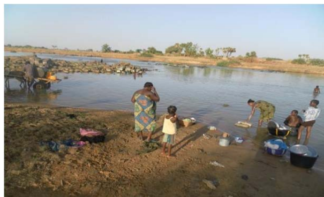
L'accès à l'eau reste un des grands défis dans la lutte contre le choléra.

Avec environ 33% des cas de rougeole rapportés en 2013, plus de 70% des cas de choléra, la quasi-totalité (98%) des cas confirmés de diphtérie, près de 17% des cas de paludisme, la région de Tillabéry a affiché un tableau épidémiologique des plus sombres au cours de cette année. Cette région est particulièrement affectée par