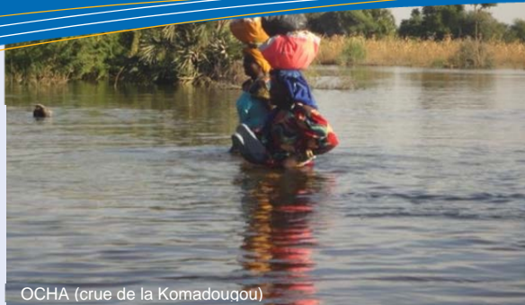
OCHA (crue de la Komadoukou)