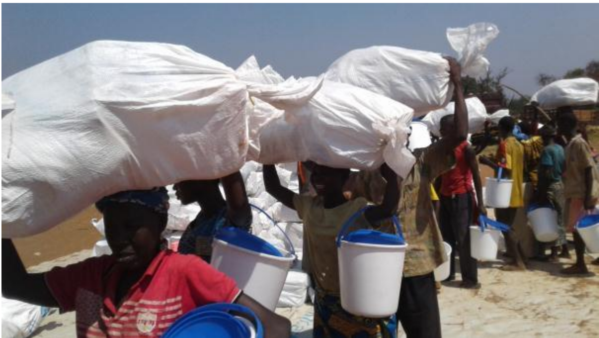
Sortie du site