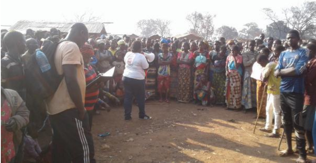
Séance de sensibilisation avant la distribution