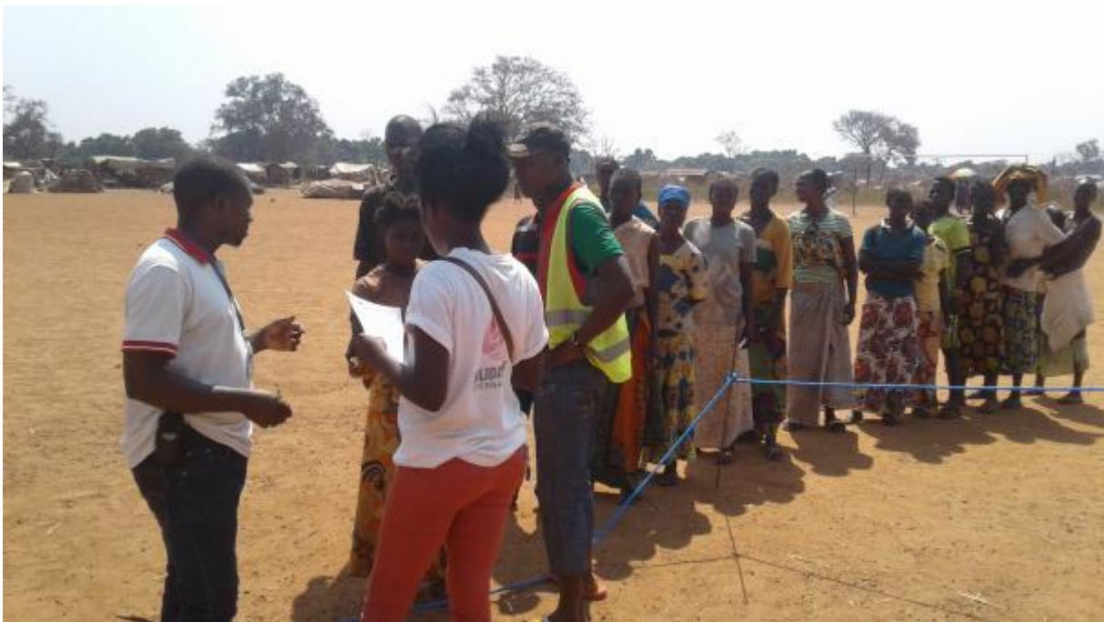
Identification des bénéficiaire avant l'émargement