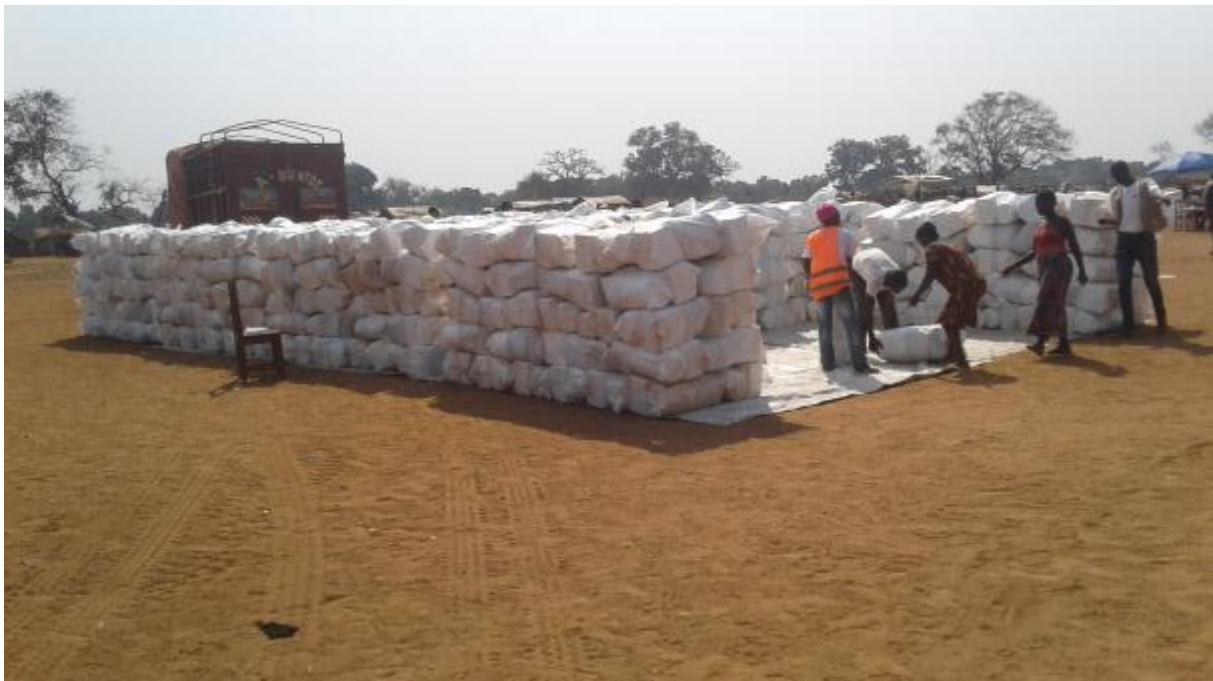
Installation des kits sur le site