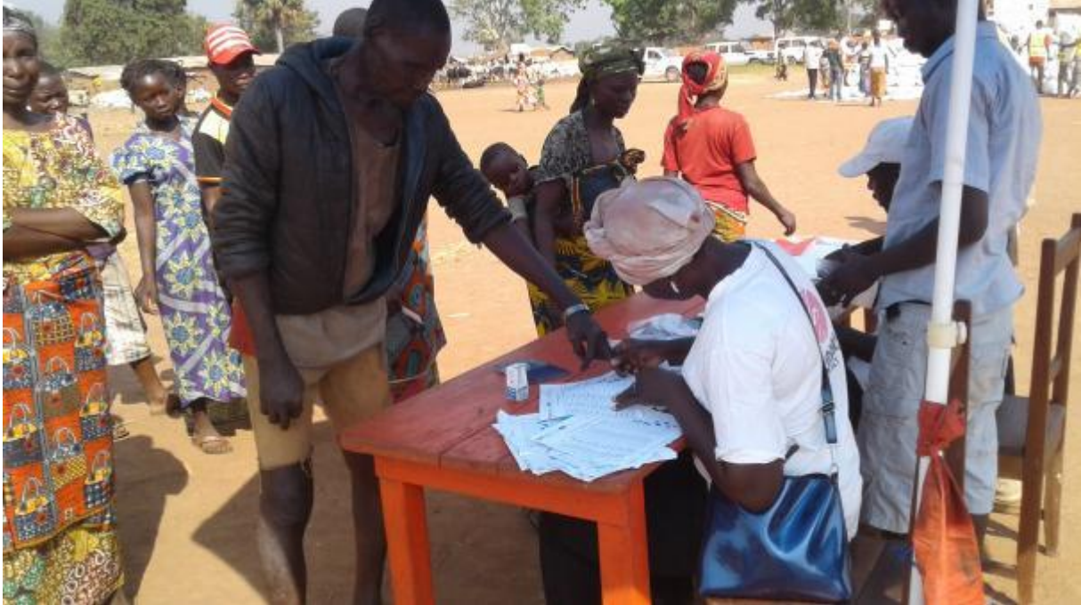
Emmargement des listes