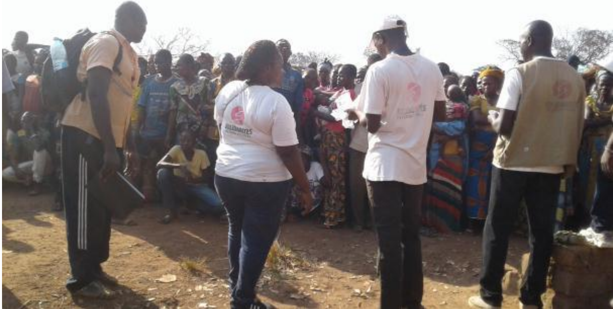
Remise des jetons site alternatif Batangafo