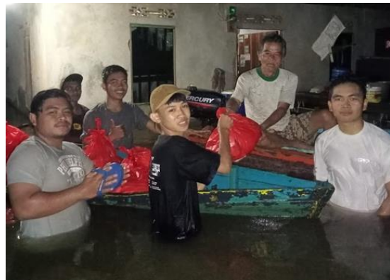
Orang Muda Katolik dibantu warga mendistribusikan bantuan di Tanjung Simba dan Ella Pinoh

Situasi Lokasi Terdampak - Caritas Keuskupan Sintang