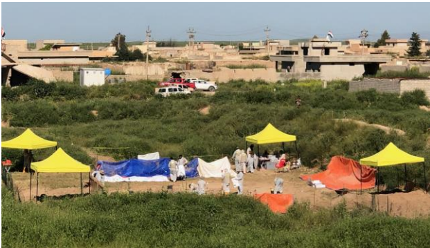
کۆچۆ، هه‌رێمی سنجار، نه‌ینه‌وا، سه‌رچاره‌ی وێنه: له‌لایه‌ن رێکخراوی UNITAD

له‌ ماوه‌ی مانگی نیسانی ٢٠١٩، رێکخراوی UNITAD (تیمی لێکۆله‌روه‌ی نه‌ته‌وه‌ی به‌کگر تووه‌مان بۆ په‌رمێدانی به‌رپرسیاریتی له‌ به‌رامبه‌ر توانه‌کانی که نه‌ه‌نجام دراوان له‌لایه‌ن داعش) و به‌رئوبه‌رایه‌تی هه‌ئالنه‌وه‌ی گۆره‌ی به‌کۆمه‌له‌ی سه‌ر به‌ حکومه‌تی عێراق هه‌ماهه‌نگی کرد له‌باره‌ی هه‌ئالنه‌وه‌ی گۆره‌کان که ده‌کۆننه‌ لادئ ی کۆچۆ، له‌ هه‌رێمی سنجار، له‌ نه‌ینه‌وا.