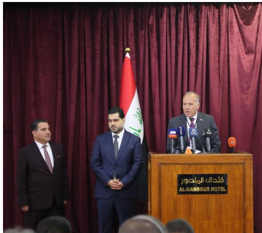
هه‌ماهه‌نگیکاری مروی به‌ریز نه‌یه‌من غه‌ریب

له رۆژی ۲۹ نیسانی ۲۰۱۹، کۆمه‌لگای مروی له عیراق و حکومه‌تی عیراق کۆنفرانسیکی هاوبه‌شیان نه‌جامدا تاکو به‌ فه‌رمی پلانی به‌هاناوه‌چوونی مروی ۲۰۱۹ راگیانن، به‌هاوته‌رییی له‌گه‌ل پلانی مروی ۲۰۱۹ حکومه‌تی عیراق.