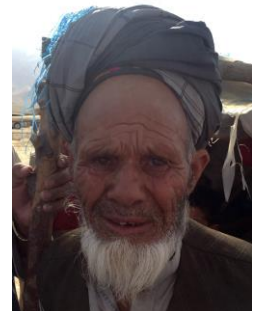
هر دو پسرش در مقابل چشمانش کشته شدند.

محب الله میگوید ما آب آشامیدنی خود را از یک حوض آبیاری میاوریم، این حوض بیست دقیقه پیاده از محل ما دورست و هربار تنها دوشکبه بیشتر آورده نمیتوانیم. چندین باشنده این محل به دلیل نوشیدن آب آلوده دچار اسهال حاد آبکی شده اند. چند هفته قبل زن محب الله به اثر اسهال در گذشت و او را در نزدیکی های این محل دفن کردند.