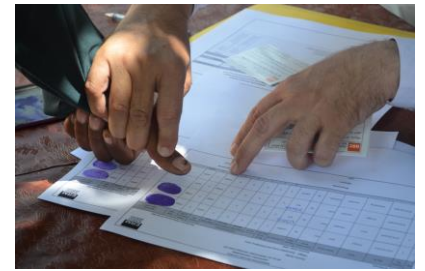
یک کارمند هیئت ناروی برای مهاجرین نشان شصت یک دریافت کننده مساعدت نقدی را در مرکز توزیع در ننگر هار میگیرد.

برنامه توزیع وجه نقد یعنی اینکه کمک ها به شکل پول نقد بحیث تبدیل کمک های جنسی غذا و اقلام خانه برای مستفیدین توزیع میگردد. این طریقه یک بخش مهم از پاسخگویی بشردوستانه در افغانستان گردیده است. سال گذشته بیشتر از ۸۰۰۰۰ نفر از موسسات همکار کمک بشردوستانه بشکل وجه نقدی دریافت کردند. در چهار ماه اول سال ۲۰۱۷ چندین موسسه خیریه و سازمان غذایی جهان ۶,۷ میلیون دالر را به ۲۴۰۰۰۰ نفر بدین طریقه توزیع نمودند. که بیشترین این مساعدت شده گان به اثر جنگ و تعدادی هم به اثر حوادث طبیعی بیجا شده بودند.