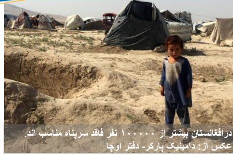
د افغانستان بیشتر از ۱۰۰۰۰۰ نفر فاقد سرپناه مناسب اند.