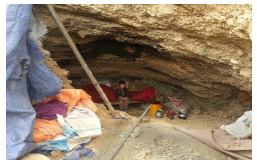
بیشتر از یک صد هزار نفر زیر خیمه، خانه های خود سازویا مغاره ها زنده گی میکنند