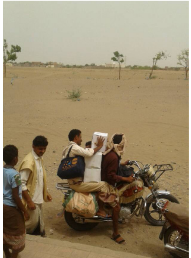
نازحون يعودون إلى منازلهم بعد حصولهم على أطعم أدوات إنتقالية من آلية الإستجابة السريعة في محافظة الحديدة.

لا يزال العمل مستمر في مرافئ الحديدة والصليف. وفي 21 يونيو، كانت هناك سفينة تجارية في الرصيف وست سفن أخرى في منطقة الرسو في ميناء الحديدة، بينما كانت هناك سفينتان أخريين تم التصريح لهما من قبل آلية التحقق والتفتيش التابع للأمم المتحدة في طريقهما إلي الميناء. هذا وقد انتهت سفينة مستأجرة تابعة لبرنامج الأغذية العالمي من تفرغ 50,000 طن متري في ميناء الحديدة.