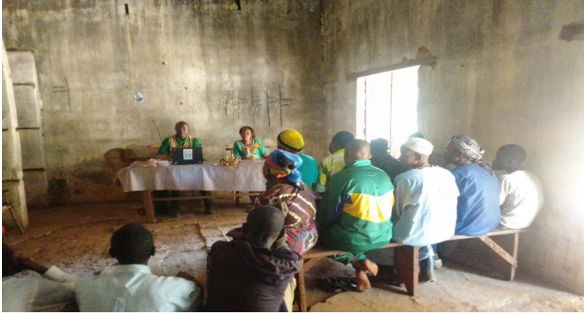
Image 1 : Concertation sur la problématique de l'éducation à Bambouti avec les autorités locales