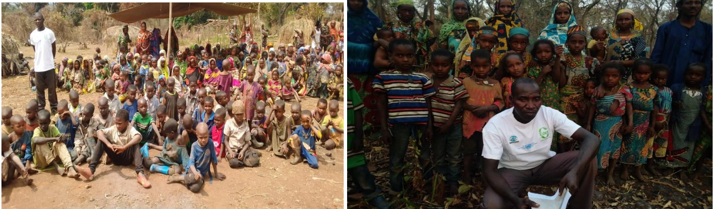
Image 3 : Quelques enfants non scolarisés du site des déplacés de Bambouti

En ce qui concerne le volet sécuritaire, la zone est relativement calme. Cependant des craintes sont émises par rapport à l'absence de l'autorité de l'Etat et la présence opérationnelle des hommes armés de l'UPC qui contrôle l'entrée et sortie de Bambouti.