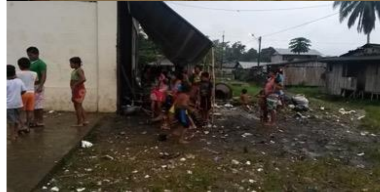
Albergue improvisado y espacios para la preparación de alimentos de familias indígenas en situación de desplazamiento en Pie de Pató.