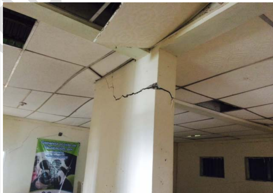
Centro de Salud Cabecera Municipal