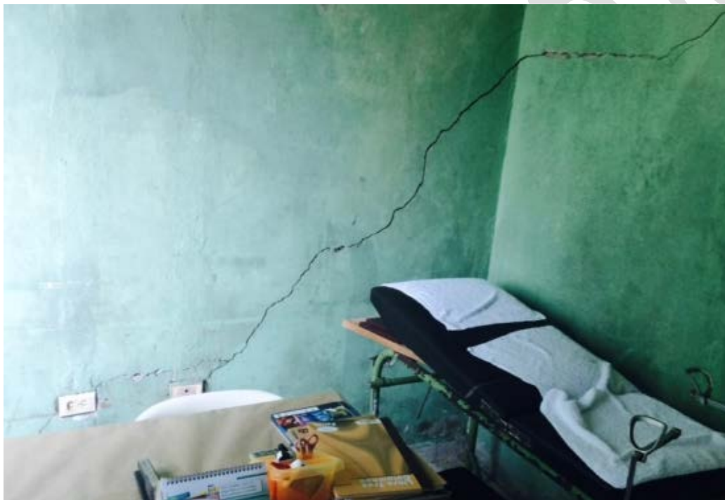
Centro de Salud Cabecera Municipal