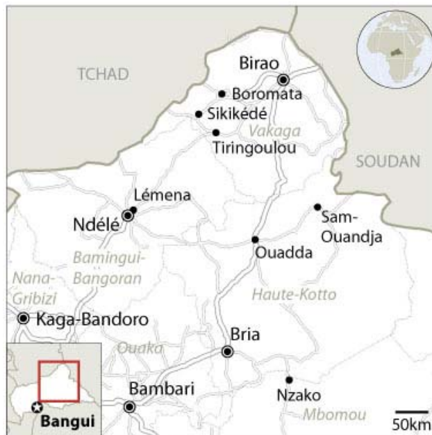
Les frontières et les noms indiqués et les désignations employées sur cette carte n'impliquent pas reconnaissance ou acceptation officielle par l'Organisation des Nations Unies. Carte créée le 21 sept. 2011.

Contactez Aissatou Toure, tourea@un.org pour plus d'informations.