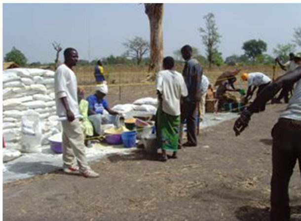
Réception des vivres par les bénéficiaires.

leur village respectif et seuls quelques ménages restés à Kabo sont dispersés dans des familles d'accueil.