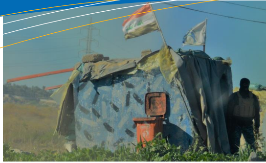
خالی پشکنینی هیزمکانی هشدی شهعی له سهلاحهیدین