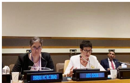
سهراوهی وینه: له لایهن نووسینگهی نهمه یهکرتوومکان بۆ ههماهنگی کاروباری مرویی

له رۆژی ۱۰ تهموزی ۲۰۱۹، یاریدهدهری سکرتری گشتی بۆ کاروباری مرویی و جیگری ههماهنگیکاری کۆمهکی تنگتاوی، بهرپز، خاتوو. ئورسولا مولر، و ههماهنگیکاری مرویی بۆ عیراق مارتا رویداس، پوختهیهکیان له بارهی بارودوخی مرویی له ناو عیراق بۆ نهندامانی وولاتان باسکرد.