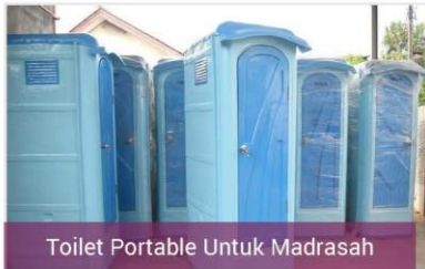
Toilet Portable Untuk Madrasah

Madrasah Terdampak Bencana Palu, Sulawesi Tengah