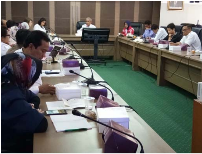
10. Forum Zakat Nurul Hayat: melakukan kegiatan di Sibalaya Selatan Tanambulava Kab Sigi Sulawesi Tengah.